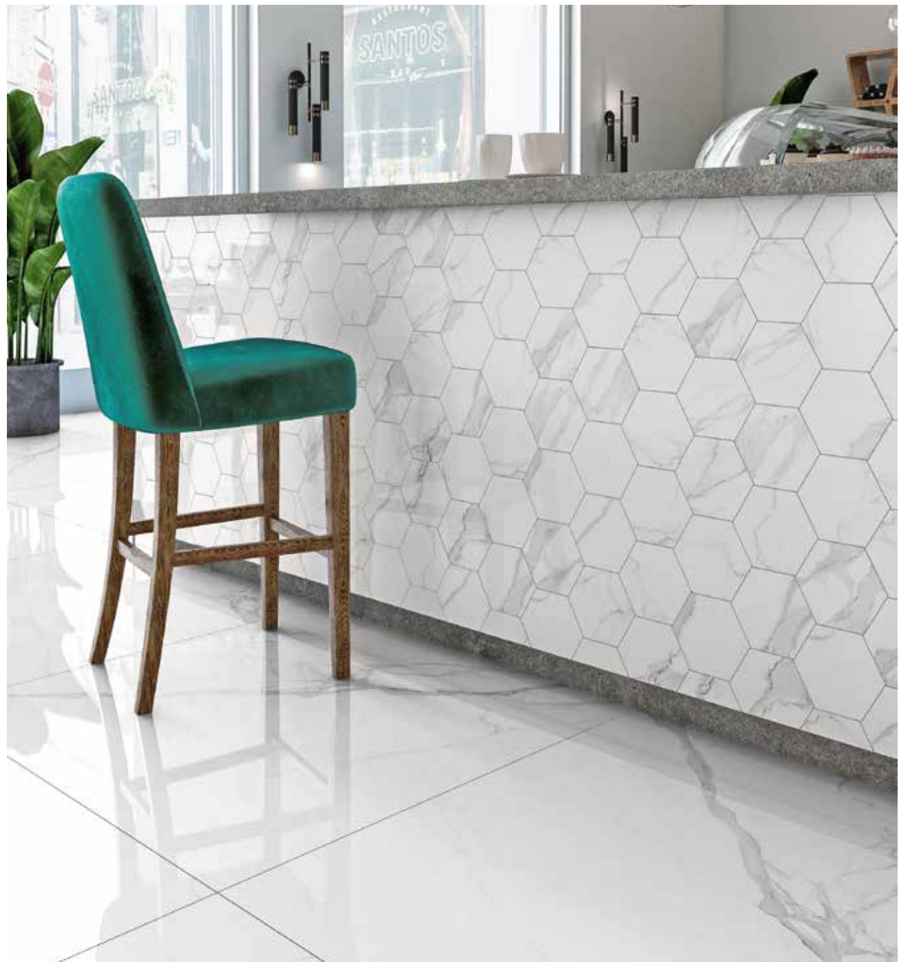
f/ floor: STATUARIO 121,0x121,0 cm LR/48"x48" LR wall: mosaico esagona STATUARIO 30x30 cm L/12"x12" L g/ CALACATTA ORO 121,0x121,0 cm LR/48"x48" LR